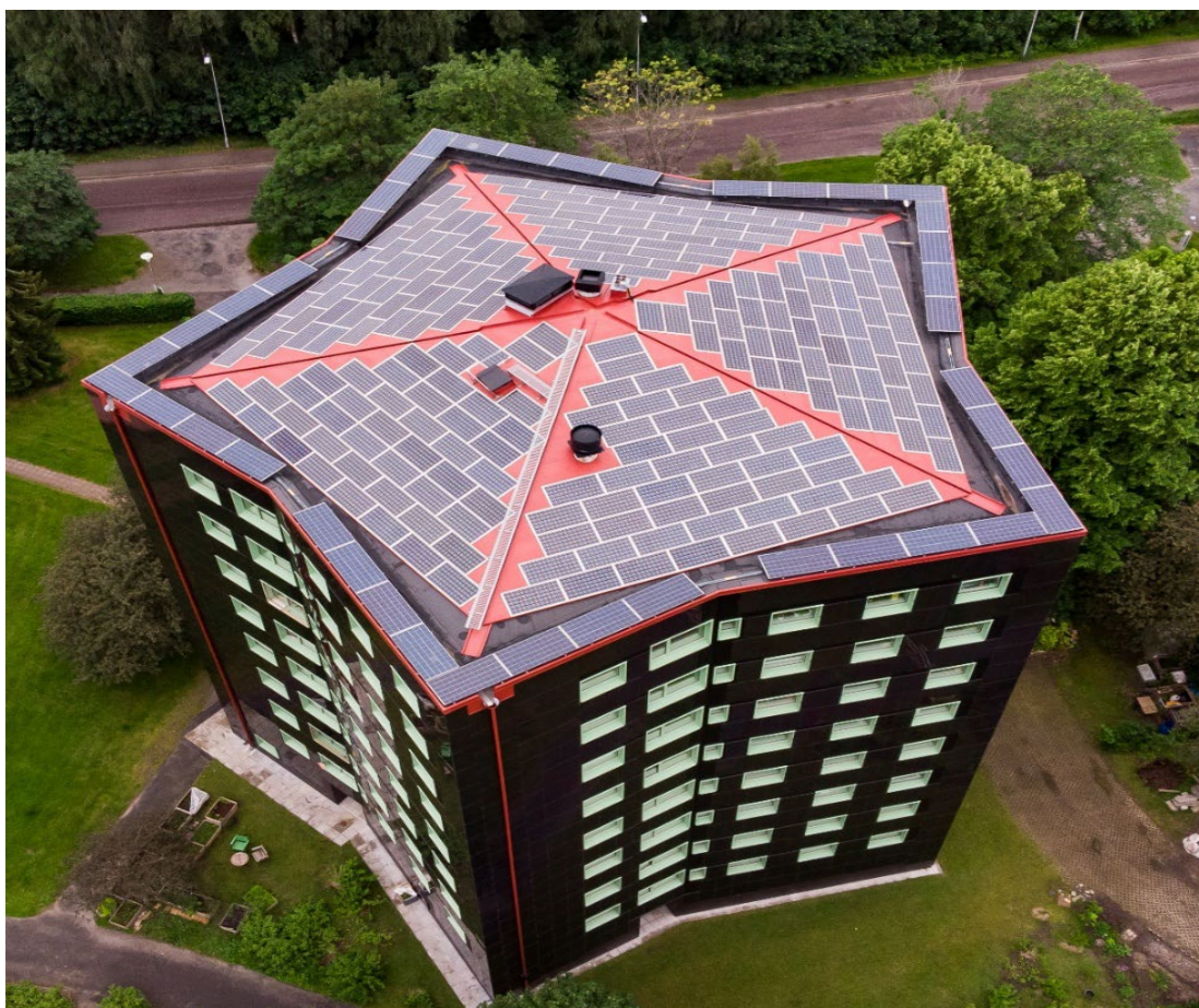
Figur 5. I kollektivhuset Stacken utanför Göteborg genomfördes flera energieffektiviserande åtgärder, bland annat behovsstyrd ventilation, smart belysning, förbättrad isolering samt nya fönster och dörrar som minskade energianvändningen. Projektet har fått finansiering från Bra Miljöval Energifond.