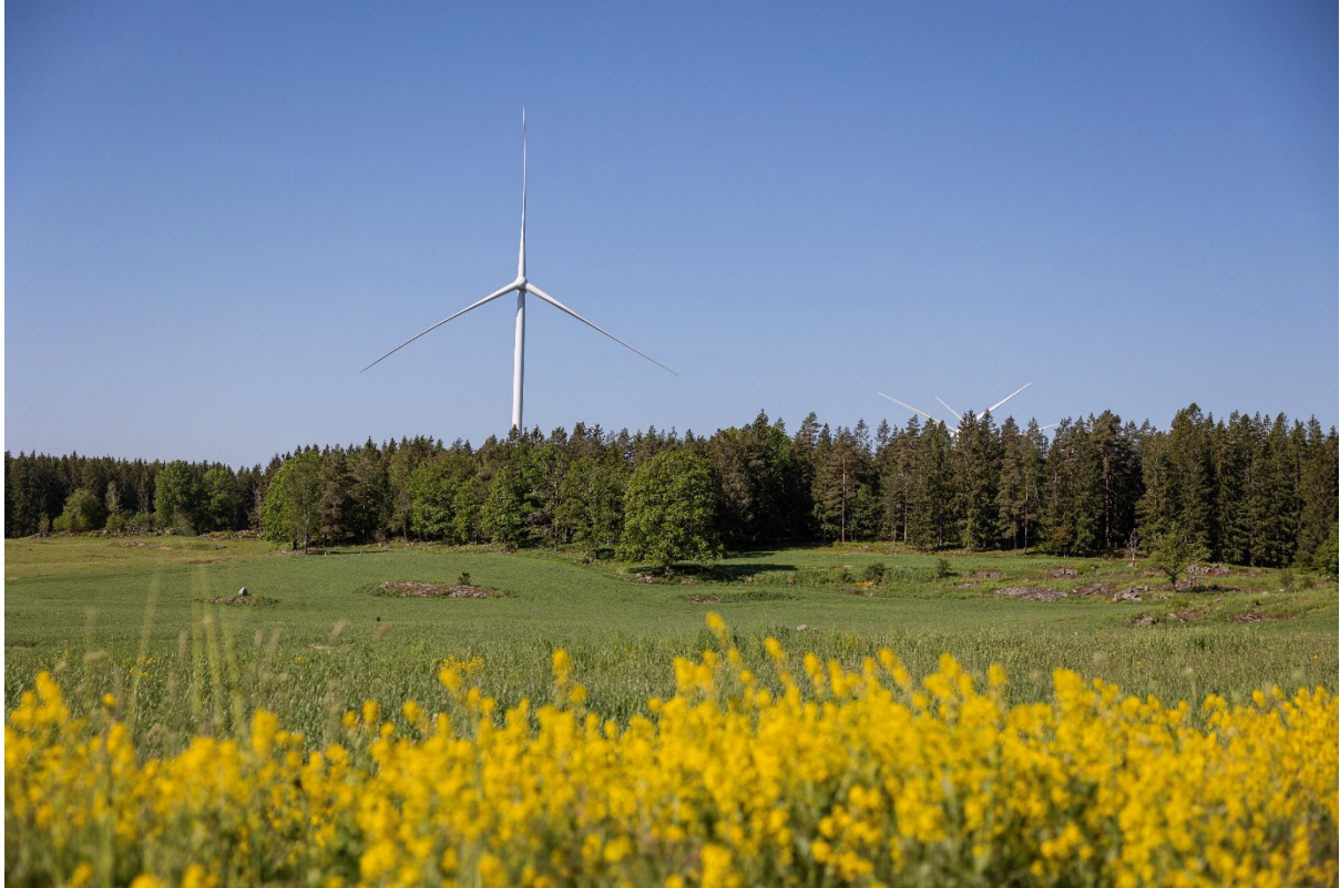
Figur 4. Eurowind Energy vindkraftpark i Lervik utanför Västervik. Vindkraftverken är placerade utanför skyddsvärda naturområden och är försedda med mjukvara för stoppreglering för att skydda fladdermöss.

Detta indikerar att skillnaden i elproduktion vid användande av mjukvara för stoppreglering är försvinnande liten. Särskilt i förhållande till den vinst som fås i form av ett rikare djurliv och ett steg framåt i att bibehålla den biologiska mångfalden som idag minskar i hög takt.