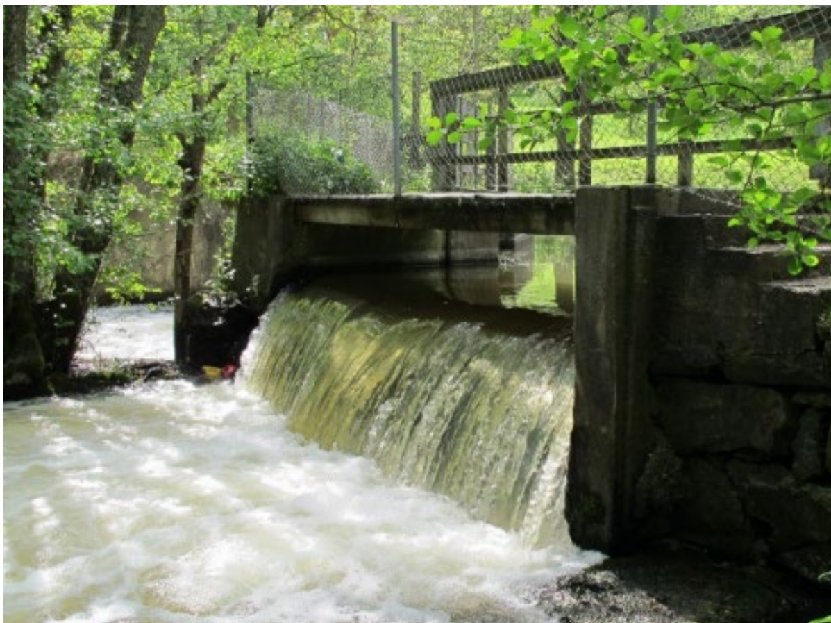
Figur 7. Trosa kommun genomförde 2022 ett fondprojekt i syfte att underlätta fiskvandring. Bilden visar Nygårdsdammen före åtgärd. Höjdskillnaden gjorde det mycket svårt om inte omöjligt för all fisk att vandra i uppströms riktning. Projektet har fått finansiering av Bra Miljöval Miljöfond.