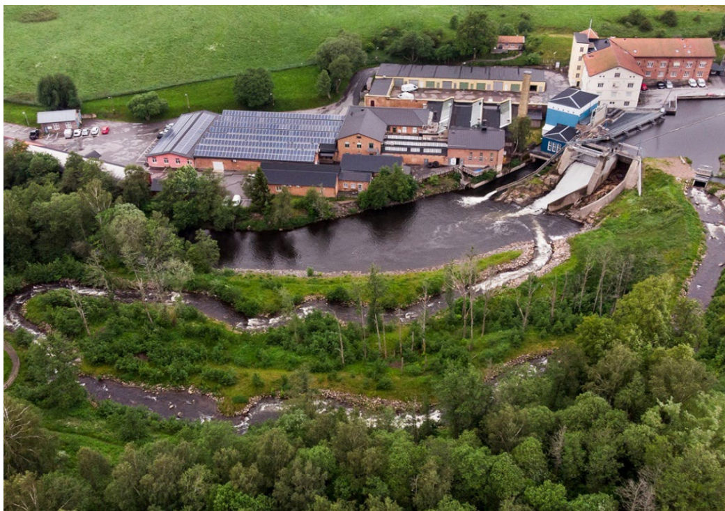
Figur 3. Hedefors vattenkraftverk, Lerums kommun. Konstruktion av naturligt omlöp för att gynna svagsimmande arter. Projektet har fått finansiering av Bra Miljöval Miljöfond.