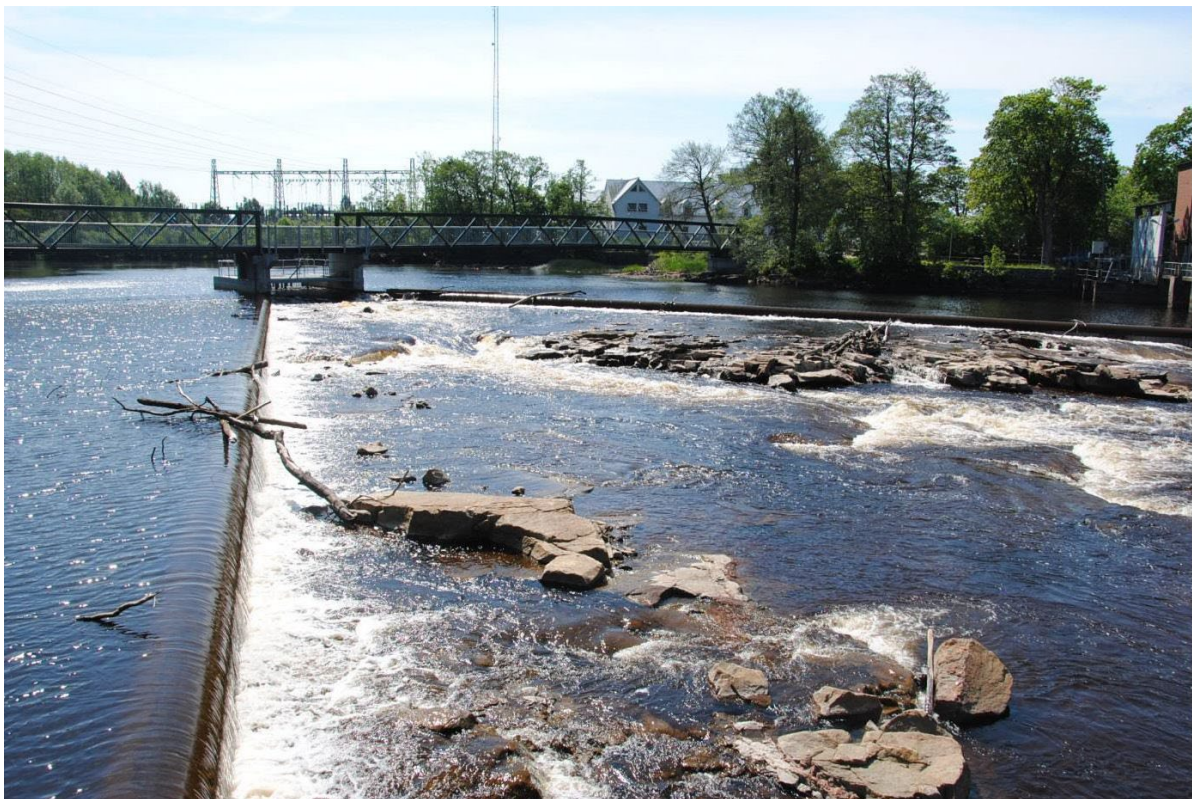
Figur 2. Hertingsforsen i Falkenberg. Rivning av vandringshinder och förbättrad fiskpassage. Projektet har fått finansiering av Bra Miljöval Miljöfond.

För att synliggöra den miljönytta som uppstår genom Bra Miljövals kriterier har data från två decenniers tillämpning sammanställts i denna rapport. Även om det inte är möjligt att kvantifiera miljönyttan i form av ett enskilt nyckeltal, redovisas här de potentiella effekter som miljökraven genererar för naturen och dess ekosystem samt vilken potentiell nytta som finns om fler produktionsanläggningar levde upp till kraven för Bra Miljöval.