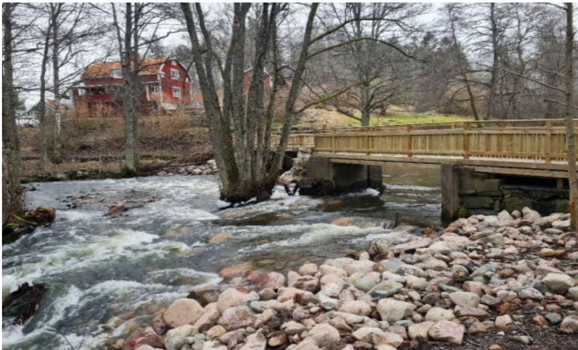
Figur 6. Trosa kommun genomförde 2022 ett fondprojekt i syfte att underlätta fiskvandring. Bilden visar Nygårdsdammen efter åtgärd. Det tidigare vandringshindret är numera passerbart för vandrande fisk. Projektet har fått finansiering av Bra Miljöval Miljöfond.

Ett exempel på utförda miljöfondsprojekt är åtgärdandet av vandringshinder i Trosa kommun under 2022 (Naturskyddsföreningen, 2023a; Trosa kommun, 2022). Sammanslagna medel från Naturskyddsföreningen, LOVA, LONA (lokala naturvårdssatsningen) och Havs- och vattenmyndigheten har där använts för att åstadkomma fria vandringsmöjligheter för havsöring samt rödlistade fiskarter som vimma, lake och ål genom borttagandet av tre större vandringshinder. Däribland åtgärdades vandringshindret Nygårdsdammen. Projektet resulterade inte bara i förbättringar i vattenmiljön, utan uppskattades även av Trosabor som nyttjar området som promenadstråk. Dessutom var det möjligt att bevara kulturmiljön runt Trosa kvarn. Även om miljöfondens fokus ligger på att förbättra biologisk mångfald i och vid strömmande vatten, är det ofta flera behov som kan tillgodoses.